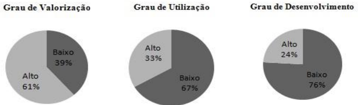
Figura 3 - Representação gráfica dos percentuais de valorização, utilização e desenvolvimento.

Analisamos, portanto, que dentro da realidade encontrada no Porto Digital, temos um quadro onde há valorização de AMM (61% das empresas demonstraram essa valorização), colaborando com todos os dados que a IDC Brasil tem relatado, os quais demonstram um forte crescimento e uma relevante importância da técnica. Porém, conforme diagnosticado neste projeto, esta valorização não é refletida em partes tão importantes como são o uso (apenas 33% das empresas demonstram o uso, quase 1/2 comparado à quantidade das que relatam valorização) e o desenvolvimento de AMM (apenas 24% das empresas relatam desenvolvimento, quase 1/3 comparado à quantidade das que relatam valorização). Sendo assim, é necessário um investimento maior nos campos de uso e desenvolvimento de AMM na cidade de Recife e conseqüentemente no estado de Pernambuco.