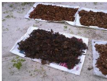
Figura 3 - Etapa de secagem pós-tratamento químico do coco babaçu

As figuras 3 e 4 mostram os cavacos da casca do coco babaçu e do eucalipto durante a etapa de secagem ao ar livre após o tratamento químico. O tempo de secagem que essas fibras foram submetidas foi por volta de 72 horas.