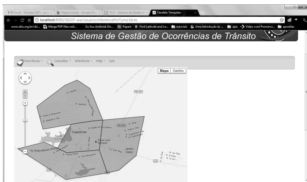
Figura 2 - Tela de inferência

A camada de negócio foi desenvolvida com o uso da tecnologia EJB, um framework que provê o desenvolvimento rápido e simplificado de aplicativos corporativos, o qual gerencia o controle transacional e da segurança. Esta camada foi dividida em dois módulos: módulo das regras de negócio: inerentes ao modelo de domínio e módulo probabilístico ou inferencial, sendo este último desacoplado da lógica própria do sistema, com o objetivo de trazer mais clareza ao projeto e promover a reusabilidade, para tal fará uso da API JavaBayes.