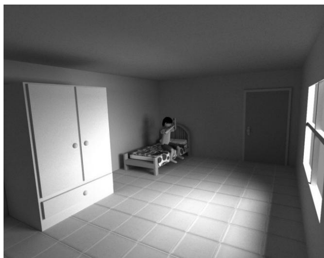
Figura 2 - Protótipo do subambiente quarto - ação acordar.

Os jogos para crianças, existentes no mercado, geralmente são projetados contendo apenas um personagem (menino ou menina). No ROTAUT, para que a criança se sinta representada em cena, existirá uma opção na configuração do sexo da criança, pois desta forma alguns ambientes seriam automaticamente modificados. Como por exemplo, no subambiente quarto, o cenário mostraria bonecas, no caso do jogador ser do sexo feminino ou bola de futebol e carrinhos, no caso do sexo masculino. Portanto, o jogo poderá ser representado por um personagem de menino ou menina. A incidência do autismo no sexo masculino é de uma proporção de 4:1 em relação ao feminino (GONÇALVES, 2008).