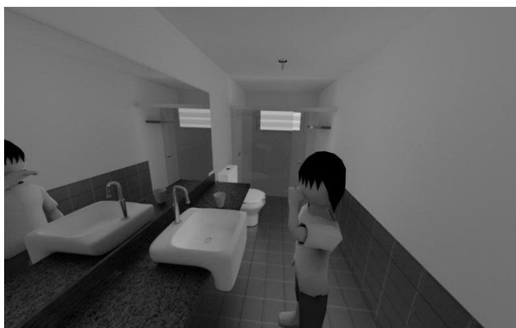
Figura 3 - Protótipo do subambiente banheiro - ação escovar os dentes.

A seguir é mostrada mais uma ação do jogo ROTAUT representada na Figura 3, que é o ato de escovar os dentes. Para muitos o comportamento e os passos em determinados ambientes são simples e automáticos, mas para as crianças autistas isso não é tão trivial. O protótipo da cena do banheiro mostrada a seguir, tenta minimizar e mostrar à criança o que deverá ser feito naquele ambiente e as ações inerentes ao citado contexto.