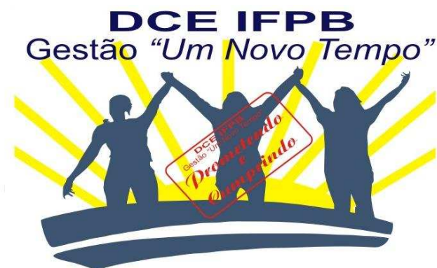
Figura 1 – Logomarca do DCE IFPB na Gestão 2010

Parágrafo Único - O DCE IFPB é uma associação civil sem fins lucrativos, de duração indeterminada, sem filiação político-partidária ou religiosa, livre e independente dos órgãos públicos e governamentais, regido pelo presente Estatuto, tem sede no Prédio Sede do IFPB, na Rua 1º de Maio, número 720, CEP: 58.015-430, do bairro de Jaguaribe na cidade de João Pessoa, e foro na cidade de João Pessoa.