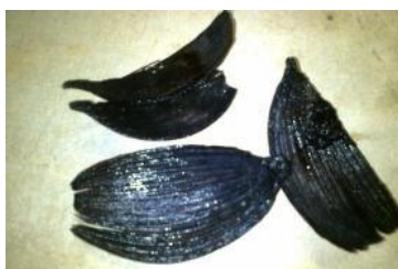
Figura 1 - Fibra da casca do coco de babaçu durante tratamento químico