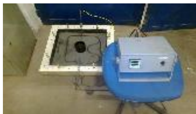
Figura 9 - Sistema de controle de temperatura do sistema de moldagem a quente

A figura 10 mostra um colchão de fibras vegetais moldado a quente (temperatura de 160 ° C) de uma composição contendo 10 % de fibras de coco babaçu e 90 % de fibras de eucalipto. Os resultados visuais mostraram que essa placa tem um grande potencial para ser aplicado como MDF.