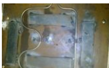
Figura 7 - Dispositivo de aquecimento inferior do molde desenvolvido

A figura 7 mostra o molde com os dispositivos de aquecimento na parte inferior, construído para a moldagem das placas de fibras vegetais. A figura 8 mostra o molde com o dispositivo de aquecimento na parte superior do mesmo. Esta sistemática de se colocar os dispositivos tanto na parte inferior quanto na parte superior do molde foi para se obter temperaturas uniformes e iguais em ambas as superfícies da placa de MDF dessas fibras vegetais.