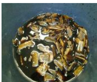
Figura 2 - Fibra de eucalipto durante tratamento químico

O objetivo de se realizar o tratamento nos cavacos foi de retirar os extrativos vegetais das fibras (lignina) de forma que se deixassem essas fibras mais consistentes e mais fáceis de serem picotadas e extraídas dos seus respectivos cavacos de origem.