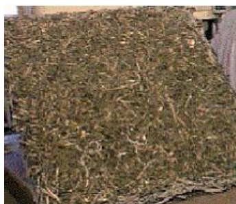
Figura 10 - Colchão de fibras

A figura 10 mostra um colchão de fibras vegetais moldado a quente (temperatura de 160 ° C) de uma composição contendo 10 % de fibras de coco babaçu e 90 % de fibras de eucalipto. Os resultados visuais mostraram que essa placa tem um grande potencial para ser aplicado como MDF.