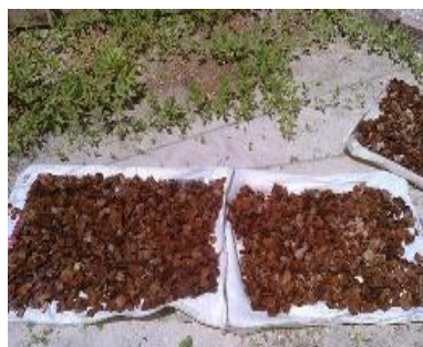
Figura 4 - Etapa de secagem pós-tratamento químico dos cavacos do eucalipto

Por essas figuras, observa-se que o tratamento químico foi eficiente através da coloração dessas fibras. Além disto, observou-se uma boa consistência dessas após o tratamento, consistência essa fundamental para a etapa de desfibramento.