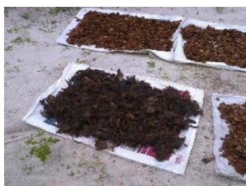
Figura 3 - Etapa de secagem pós-tratamento químico do coco babaçu

As figuras 3 e 4 mostram os cavacos da casca do coco babaçu e do eucalipto durante a etapa de secagem ao ar livre após o tratamento químico. O tempo de secagem que essas fibras foram submetidas foi por volta de 72 horas.