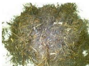
Figura 5 - Fibras da casca do coco babaçu obtidas em máquina forrageira

do tipo forrageira. As figuras 5 e 6 mostram as fibras da casca do coco babaçu e do eucalipto obtidos após o picotamento em máquina forrageira. Observa-se que as fibras obtidas do coco babaçu tiveram uma coloração mais escura comparada com as fibras obtidas do eucalipto. Isto se deve a diferença dos teores e tipos de extrativos existentes em cada uma desses materiais. Entretanto, praticamente não houve variações dimensionais e nem de consistência entre essas fibras.