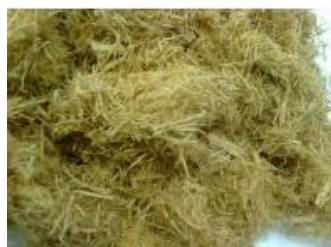
Figura 6 - Fibras da casca do eucalipto obtidas em máquina forrageira

A figura 7 mostra o molde com os dispositivos de aquecimento na parte inferior, construído para a moldagem das placas de fibras vegetais. A figura 8 mostra o molde com o dispositivo de aquecimento na parte superior do mesmo. Esta sistemática de se colocar os dispositivos tanto na parte inferior quanto na parte superior do molde foi para se obter temperaturas uniformes e iguais em ambas as superfícies da placa de MDF dessas fibras vegetais.